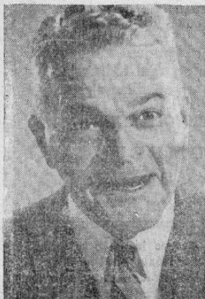
E. S. F. 40-V