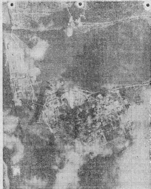
Los terribles efectos de un ataque diurno de bombarderos norteamericanos a los importantes establecimientos industriales que los nazis tienen cerca de Oslo, Noruega.