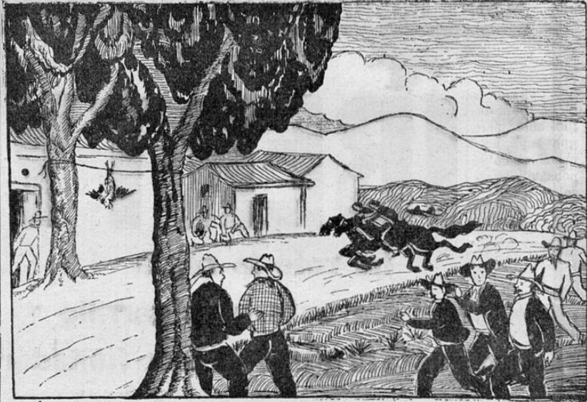
LAS CARRERAS DE SAN JUAN la "Ginebra extra-fina", con Gin-Aie y limón, entona, reanima y sienta entre los Licores Nacionales sobresa a bien.

se benefician con su talento que renovar le el contrato? En mi concepto los afortunados han sido los productores que han logrado que él acepte un compromiso por tres años, ya que eso les asegura un mínimo de seis películas, que sin duda alguna tendrán éxito, lo cual quiere decir que una millonada de dólares entrarán en las taquillas de los teatros.